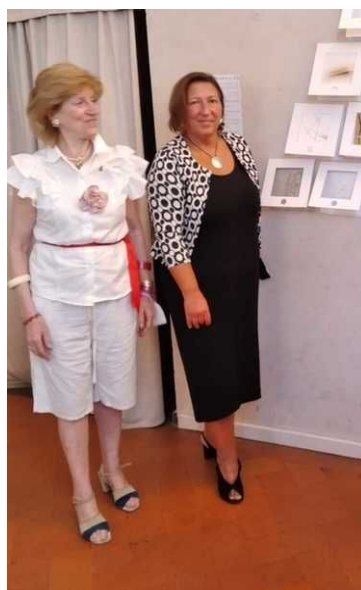
La presentazione di Artour-O il Must, XXXIII edizione

Queste le sezioni in cui si articola l'appuntamento: Focus, Artour-o a Tavola con Dante, Artour-o d'Argento, Percorso espositivo con le Tetraktys,